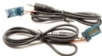
Lichtschranken (2 x)