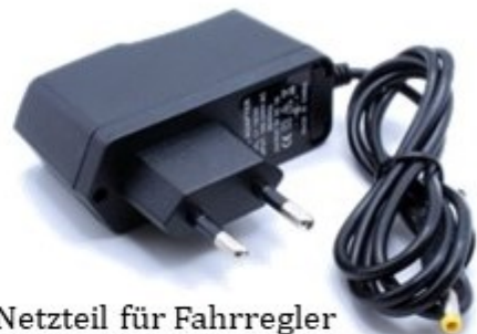
Netzteil für Fahrregler (der Fahrregler kann auch mit 3 Stück AA/R6 Batterien betrieben werden)